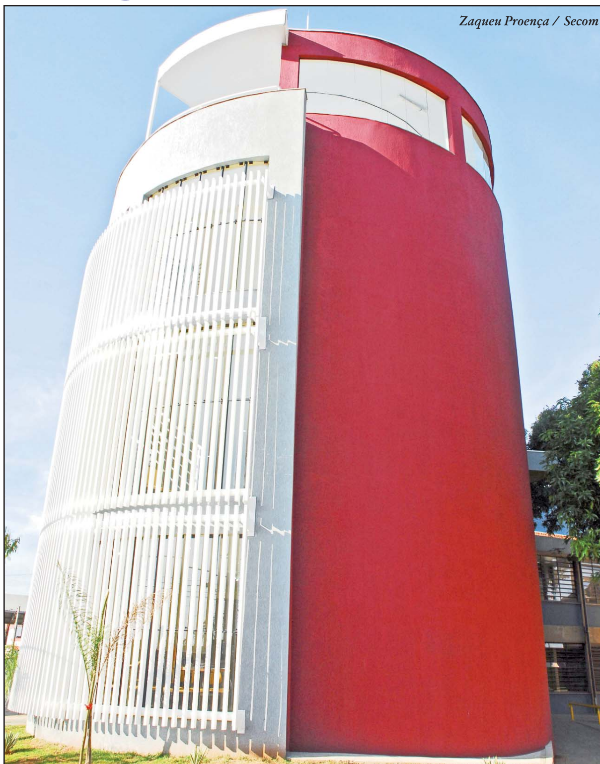
Zaqueu Proença / Secom

Os Sabe Tudo já existem em cinco bairros: Ipiranga, Paineiras, Marcelo Augusto, Hungarês e Conjunto Habitacional Ana Paula Eleutério, anexos às escolas. E funciona de segunda a sexta-feira, das 8h às 20h, e aos sábados, das 8h às 13h.