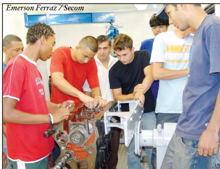
Emerson Ferraz / Secom

CURSOS - Até o dia 22, a Secretaria de Cidadania (Secid) recebe inscrição para cursos desenvolvidos no Centro Integrado de Apoio à Pessoa Portadora de Deficiência (CIAPPD). Os interessados devem comparecer ao Centro de Integração Social (CIS) de Vila Gabriel, que fica na rua João Gabriel Mendes, 351, das 8h30 às 11h30 e das 13h30 às 16h. Os cursos são destinados às pessoas com deficiência e voltados à geração de renda extra e aprimoramento de habilidades. Para se inscrever, a pessoa deve apresentar RG, CPF e comprovante de endereço (documentos originais). As vagas são limitadas.