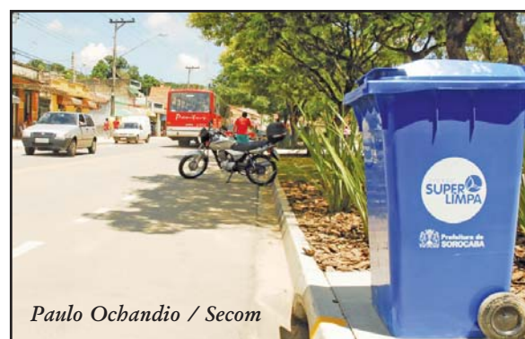
Moradores de Brigadeiro Tobias já contam com o sistema mecanizado.

A coleta mecanizada deve atender todas as regiões da cidade até o fim do ano, por possibilitar uma maior velocidade aos serviços, além de os contêineres preservarem