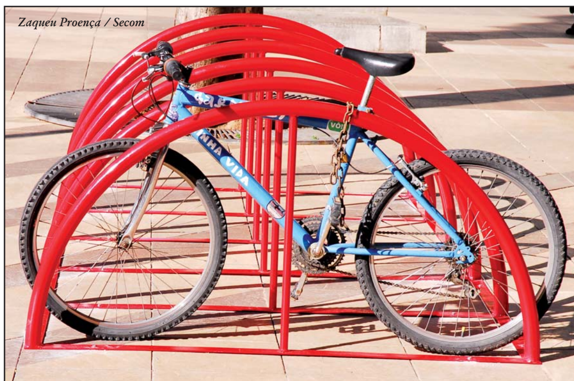
Cada Paraciclo tem capacidade para guardar doze bicicletas.

Também está prevista a construção de um bicicletário ao lado do Terminal Santo Antonio. Diferente do paraciclo, o bicicletário será fechado e terá maior capacidade.